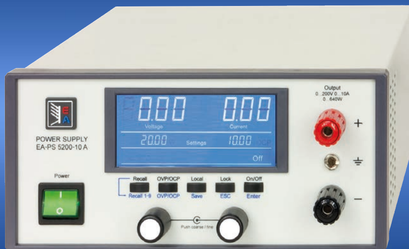
EA-PS 5200-10 A